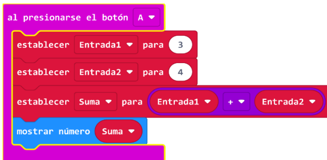
Figura 2 - Diseño implementado para el numeral 1

https://makecode.microbit.org/_R2u6cf7RW2kt ), en MakeCode: