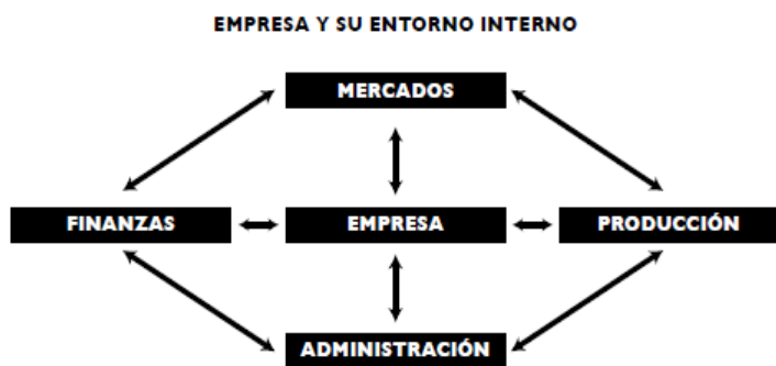
Figura 2 – Empresa y sus áreas internas

La Figura 2 indica las áreas internas de la organización, que son las cuatro áreas principales de la empresa; en conjunto, permiten el desarrollo del objeto social de la empresa y el manejo organizado de la misma. A pesar de que las áreas se analizarán con mayor detalle en capítulos posteriores, es necesario mencionarlas en simultánea con el concepto de empresa, dado que un factor clave para su operación es la capacidad de integración de las mismas.